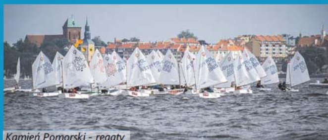
Kamień Pomorski - regaty

5. Projekty współpracy międzynarodowej pomiędzy nauką i światem gospodarczym w tematyce związanej z gospodarką morską, żegluga śródlądową i turystyką (w szczególności wodną). Projekty te obejmowałyby wymianę ekspercką wewnątrz regionu i miałyby na celu utrzymanie oraz zwiększanie kapitału ludzkiego w tych dziedzinach.