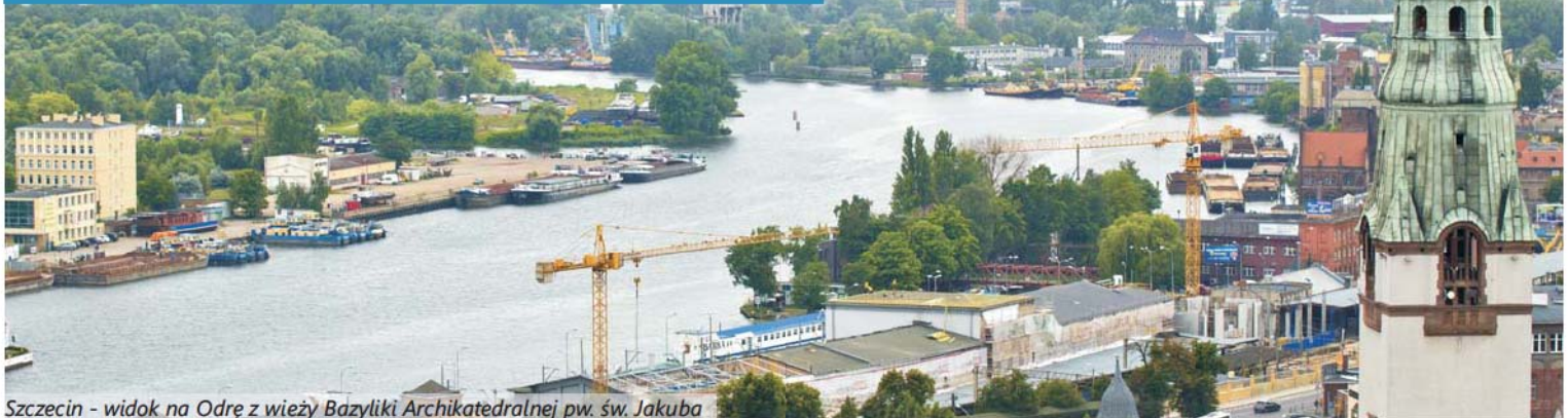
Szczecin - widok na Odrę z wieży Bazyliki Archikatedralnej pw. św. Jakuba

Położenie nad wodą i jego maksymalne wykorzystanie jest punktem wyjścia przyszłych działań konsolidacyjnych i rozwojowych na obszarze TRMS – również przy uwzględnieniu wymogów prawnych i interesów ochrony przyrody oraz środowiska naturalnego. Stanowi o przewadze konkurencyjnej, wynikającej z dostępności do akwenów żeglownych: Bałtyku, Zalewu Szczecińskiego, jeziornych i rzecznych. Korzyści z położenia nadwodnego są rozpatrywane w kontekście osadniczym, gospodarczym i turystycznym.